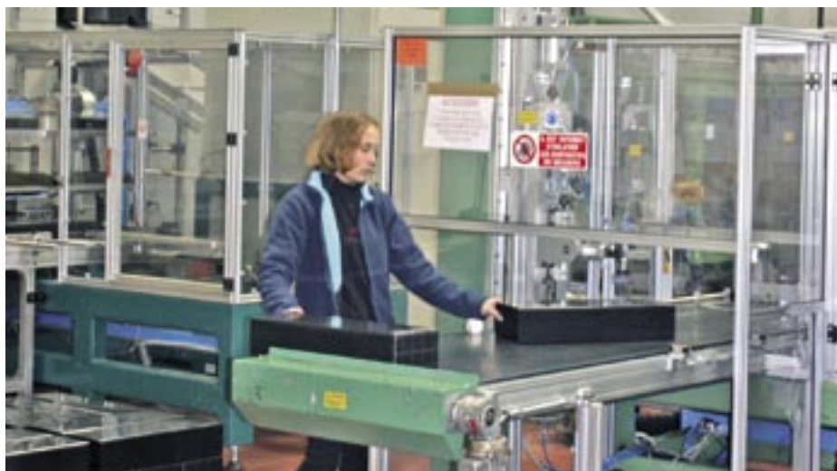
Plastam, fabricant de boîtiers en plastique pour batteries, prévoit la création d'un nouvel atelier en 2006.

Si l'on dresse un premier bilan, la réponse est positive. Artoipole accueille aujourd'hui 41 entreprises qui ont généré 1857 emplois. En dix ans, la zone d'activité a su capter de grands groupes étrangers comme l'américain Caterpillar ou le japonais Akebono (plaquettes de frein). Mais cela n'a pas toujours été sans d'âpres et très