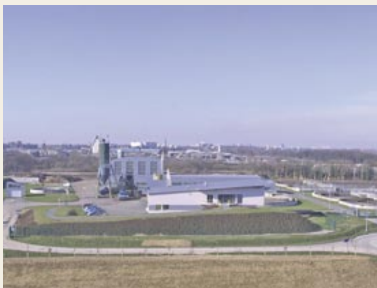
La station d'épuration constituera le site Ecopole avec la déchetterie, Arthélyse et le futur centre de tri.

1 Le SMAV traite les déchets ménagers de 121 communes réparties sur les territoires de la CUA, du syndicat mixte de la région de Bapaume et des communautés de communes de l'Artois et du Val de Gy