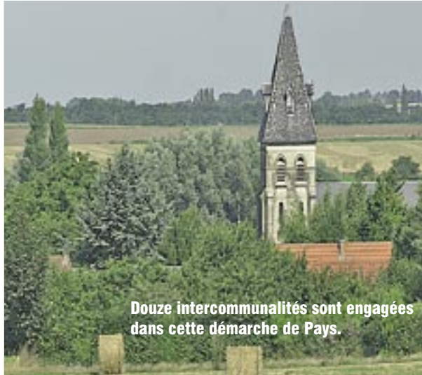
Douze intercommunalités sont engagées dans cette démarche de Pays.

En approuvant la charte du Pays d'Artois, la Communauté urbaine d'Arras et onze autres établissements publics de coopération intercommunale (EPCI) ont clairement affirmé leur volonté de se rassembler autour d'un même projet de territoire. Défini par la loi Voynet de juillet 1999, le Pays n'est pas une institution de plus. C'est un cadre de réflexion commun sur le développement et l'aménagement du territoire. La maîtrise d'ouvrage des projets reste toutefois du ressort exclusif des EPCI, qui conservent leurs compétences. Cette démarche donne également la possibilité aux intercommunalités de parler d'une même