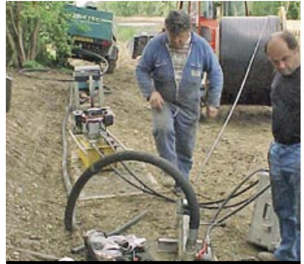
La Communauté urbaine a passé une DSP avec le groupement SOGEA-MARAIS

La Communauté urbaine a signé le 5 octobre dernier un contrat de délégation de service public avec la société Arras Networks, filiale du groupement SOGEA-MARAIS ( groupe VINCI ) dont l'offre a été retenue pour assurer la construction, l'exploitation technique et commerciale, quinze ans durant, de la boucle numérique locale. Avec cet accord, le projet d'infrastructures de télécommunications à haut et très haut débit lancé en 2002 entre dans sa phase concrète. Les travaux ne devraient pas prendre plus de 8 ou 9 mois. Ils aboutiront à la mise en service d'une boucle de 83 kilomètres en novembre 2005, la première à voir le jour dans le Nord-Pas-de-Calais. Elle irriguera tous les pôles et les zones d'activités situées sur le territoire de la Communauté urbaine mais aussi les principaux établissements publics. Bien entendu, les particuliers qui le désirent pourront bénéficier de services à haut et très