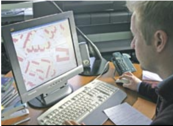
Outre les données cadastrales, Cadamap-x permet d'afficher les réseaux d'assainissement à l'écran.

Et le résultat vaut le coup d'œil. La totalité des parcelles d'une section donnée s'affichent en couleur à l'écran avec en prime, le détail des réseaux d'eau et