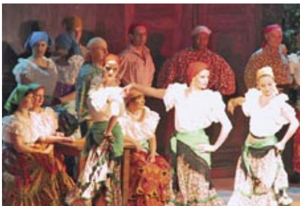
Les spectateurs pourront assister à ce grand rendez-vous musical, les samedi 8 et dimanche 9 janvier.