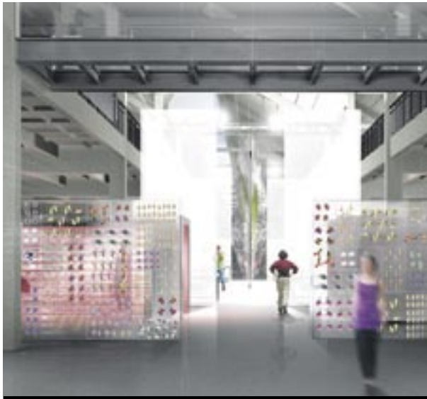
Cité Nature, centre culturel et scientifique sera inauguré au printemps prochain.

• Toujours dans le secteur de l'entrée nord d'Arras, un vaste parking gratuit de 580 places va être mis en service sur les terrains où