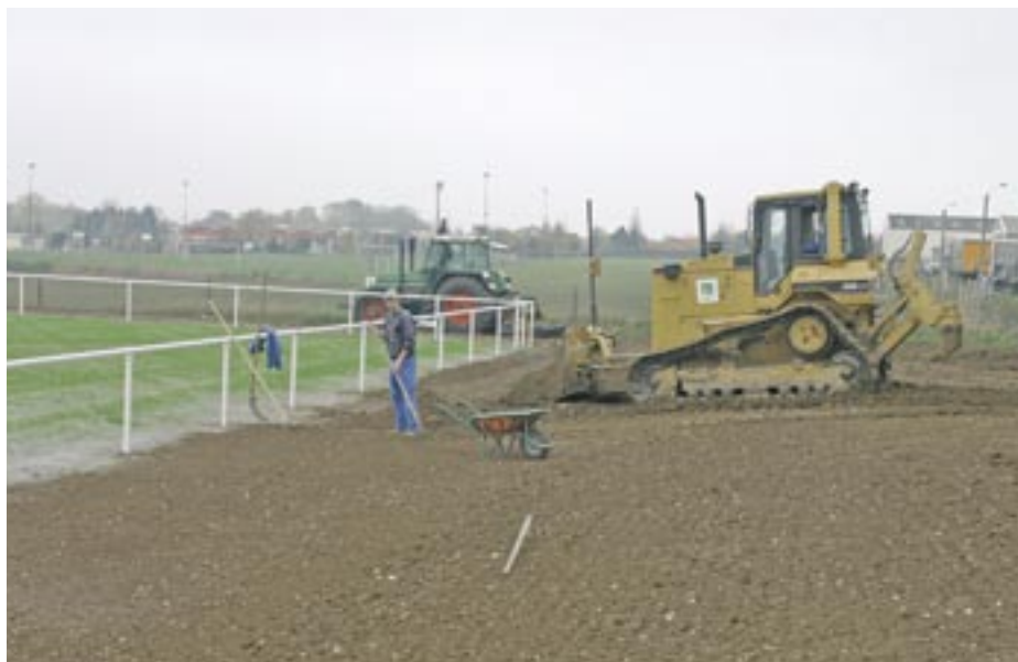
La mairie de Sainte-Catherine a fait l'acquisition d'une parcelle de deux hectares, près de la résidence des Croix.

Depuis quelque temps, les dirigeants du club avaient fait part de ce besoin, l'Etoile Sportive étant amené à multiplier les rencontres avec d'autres équipes. Les effectifs du club sont par ailleurs en hausse constante, notamment chez les jeunes licenciés qui jouent au sein de l'Etoile sportive Brunehaut (celle-ci fédère des joueurs des clubs de Sainte-Catherine et d'Anzin-Saint-Aubin). Le club dispose à ce jour de trois terrains officiels, dont un pour l'organisation de