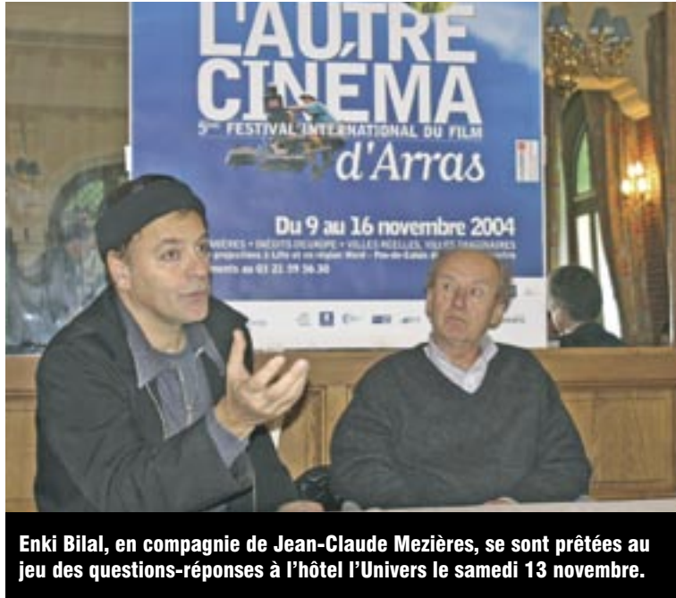
Enki Bilal, en compagnie de Jean-Claude Mezières, se sont prêtés au jeu des questions-réponses à l'hôtel l'Univers le samedi 13 novembre.

C'est un film atypique qui a une dimension théâtrale involontaire. Une partie de l'histoire se déroule sur la lune. Ce film est un vrai défi technique, avec le corps des acteurs retravaillés en image de synthèse. Et puis, une histoire d'amour entre un Dieu égyptien, une extra-terrestre et un humain, ça ne court pas les rues ! Transposer un univers de BD au cinéma, c'est un pari fou. J'avais envie de