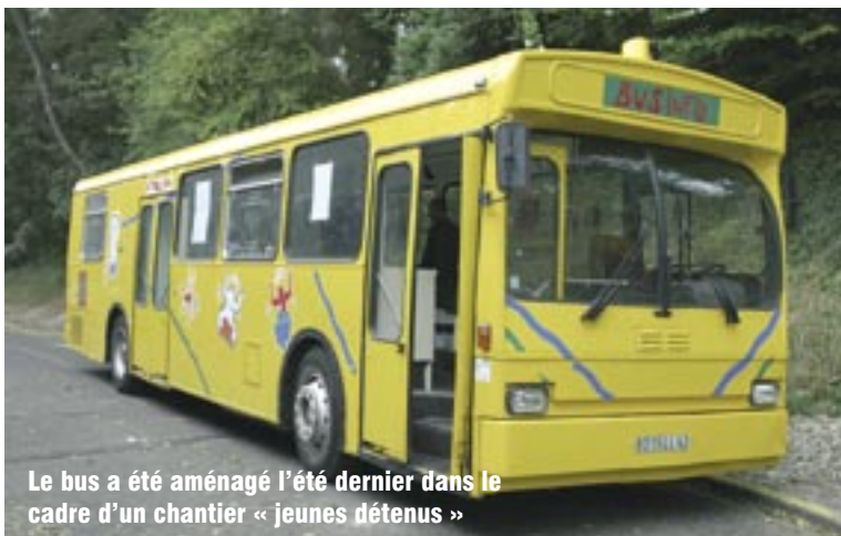
Le bus a été aménagé l'été dernier dans le cadre d'un chantier « jeunes détenus »