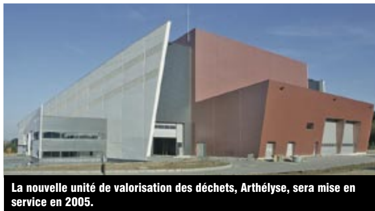
La nouvelle unité de valorisation des déchets, Arthélyse, sera mise en service en 2005.

En février prochain, une nouvelle déchetterie puis une recyclerie construites en conformité avec les normes européennes prendront du service. En 2006, l'Ecopole sera renforcé par la réalisation d'un centre de tri géré par le SMAV. Affichant une capacité de 10 000 tonnes, ce centre sera